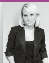
Marta Wawszczyk architekt

HG-D2A to dom parterowy skomponowany na planie prostokąta. W strefie nocnej znajdują się trzy sypialnie, łazienka i garderoba, strefę dzienną tworzą zaś otwarta kuchnia i salon. Ze względu na prostą formę bryły zaproponowano minimalistyczny wystrój wnętrza. Biel mebli przełamano jedynie dodatkami których zmiana daje możliwość szybkiego odświeżenia wnętrza.